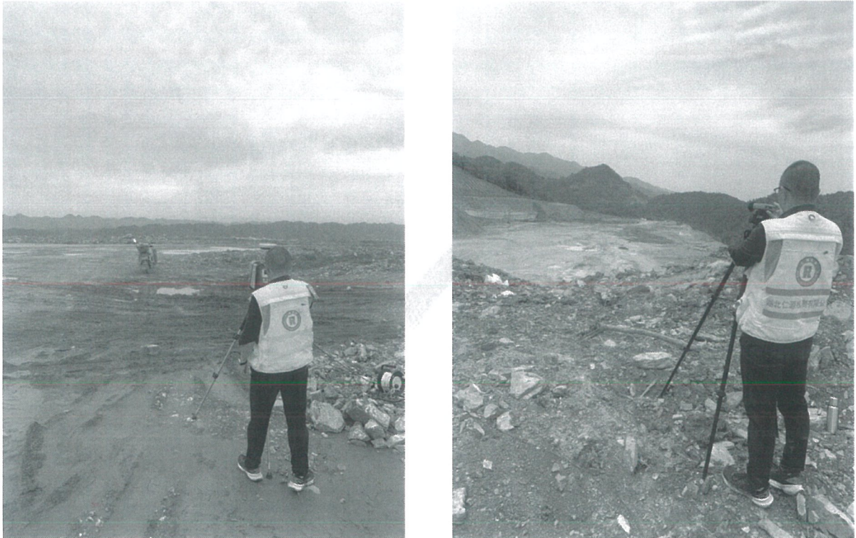
图8-3 部分现场采样照片