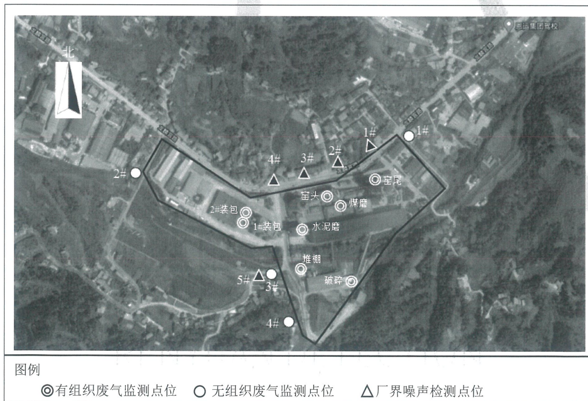
图 8-1 水泥生产线监测点位分布图