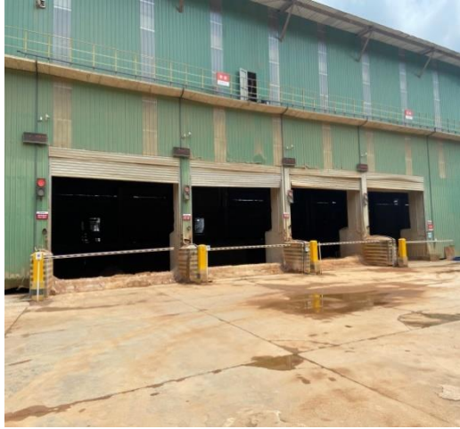
图 3-2 联合储库