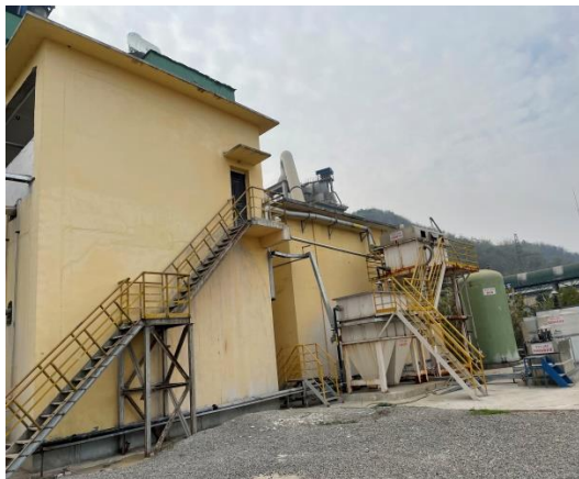
图 3-6 水洗窑灰