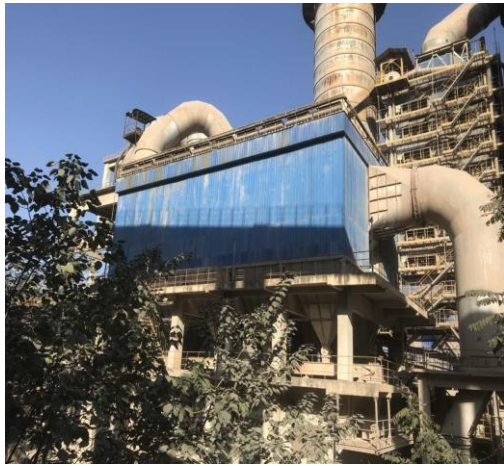
图 3-4 窑尾除尘设备