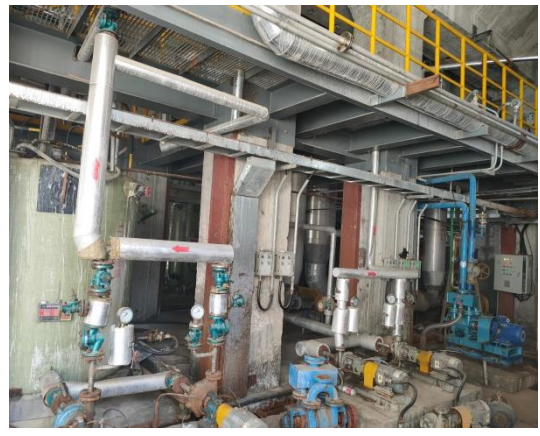
图 3-7 提盐装置