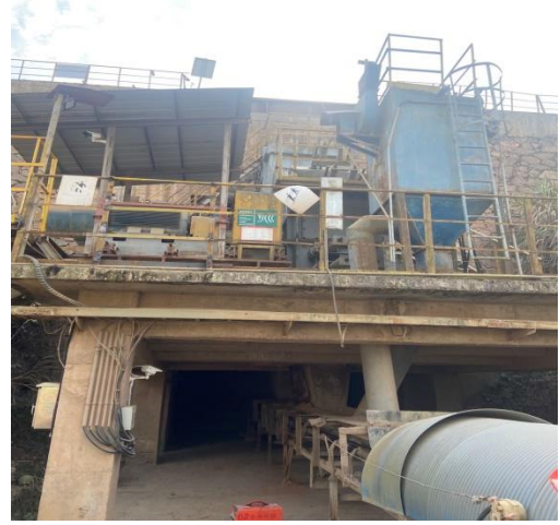
图 3-3 砂岩破碎