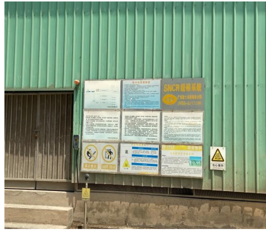
图 3-5 SNCR 脱硝系统