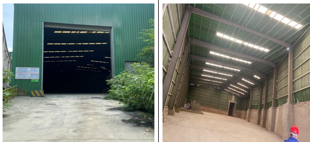
图 3-1 污泥储库